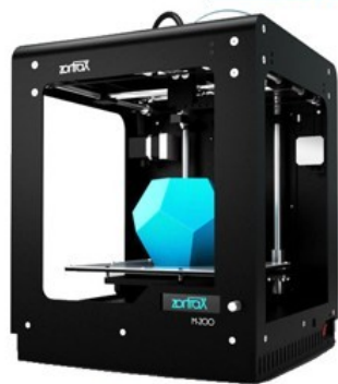
Par addition de matière avec une imprimante 3D.

Le prototypage rapide de structures consiste à réaliser des pièces mécaniques :