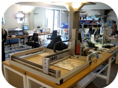
Un « Fab Lab »

Pour obtenir un prototype d'un objet communicant afin de le tester, la démarche de prototypage peut avoir lieu dans un fab lab (contraction de l'anglais fabrication laboratory , «laboratoire de fabrication»). C'est un lieu ouvert au public où sont mis à disposition des outils et des machines-outils pilotées par ordinateur, pour la conception et la réalisation des premiers exemplaires d'un objet.