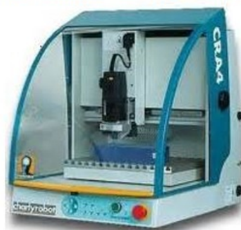
Par enlèvement de matière par fraisage avec le Charlyrobot.