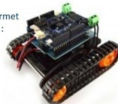
Par assemblage de cartes électroniques programmables (Arduino, Picaxe ...) et de différents capteurs et actionneurs.

Le prototypage rapide de circuits de commande permet par exemple de réaliser des robots programmables :